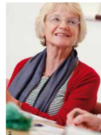
图片 1. 2008年苏格兰学校风筝节 2. 在孔子学院进行汉语学习的学生之一 3. 扬琴介绍课 4. 在邓弗姆林安妮女王高中“中国日”活动，学生们正在练习书法

正如音乐家作曲家、孔院音乐教师叶剑豪所说：“人们不仅需要了解中国文化，而且需要对今日的世界有所了解——今日世界需要的是不同的国家相互了解、共同协作。”