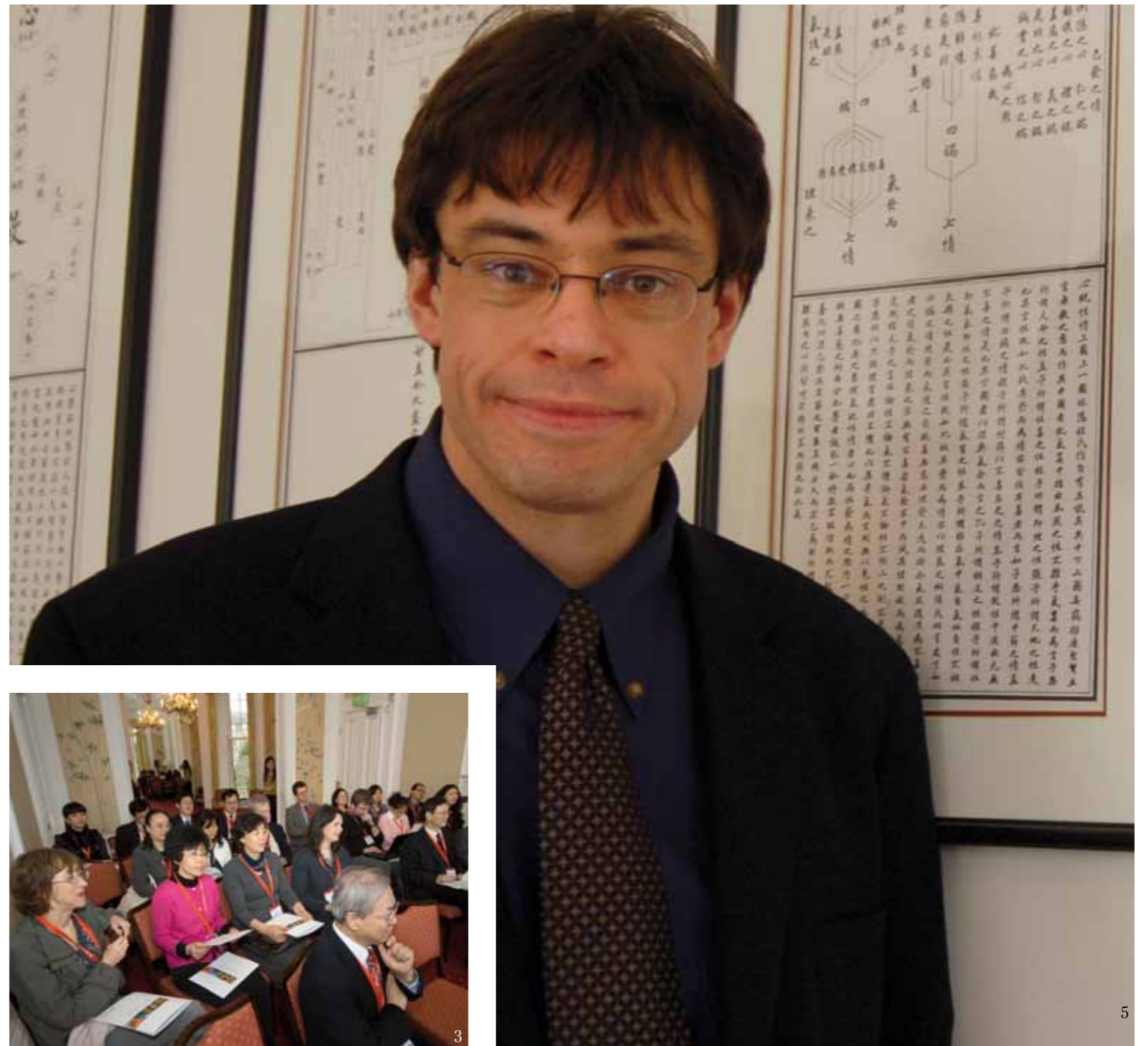
图片 1. 英国汉语教学研究会的代表与苏格兰孔子学院院长费南山教授在一起 2,3&4. 学院定期举行讲座、研讨会和各类会议 5. 哈佛大学普鸣教授参加“古汉语”研讨会

为推动对于当代中国的理解，我们提供了权威的学术和专业信息。学院从世界各个高校邀请了学术权威到爱丁堡进行演讲，演讲者来自哈佛、华盛顿、加利福尼亚大学洛杉矶分校、法兰克福社会调查学院、奥斯陆、海德堡、清华、北大、复旦、南洋理工以及香港大学等。三百多名学术专家在学院发表学术演讲，或者参加会议，与同行以及社会相关人士交流学术及专业经验。