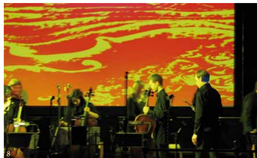
图片 第十页和第十一页 1. 爱丁堡皇家植物园灯节 2. 张曼玉教授大师班 3. 贵州黔东南州民族歌舞团在荷里路德宫 4. 北京电影学院制作的仲夏夜之梦 5. 时代中国在苏格兰的笛子演奏家 6. 中国人本纪实摄影展宣传传单 7. 中国苏格兰电影节 8. iMAP在麦考恩礼堂举行的《行者与绿洲》音乐会

“苏格兰孔子学院汇聚各种项目合作伙伴群策群力加入活动的 能力 ，加上组织大型活动缔造的影响力， 不仅保证了活动参与者来源和背景的多样化 ，并且促进了一些非常重要的 可持续合作关系的发展 ” Lord Smith of Kelvin 时代中国在苏格兰赞助人